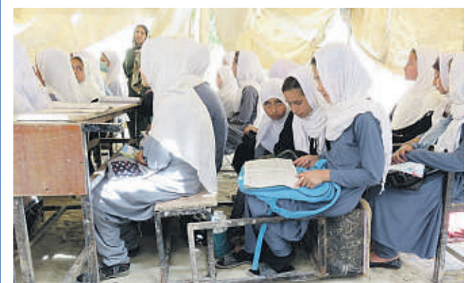
Schulen und Frauenzentren ermöglichen Mädchen außerhalb ihrer Privathäuser zusammenzukommen und zu lernen.

Alle Frauenprojekte laufen erfolgreich, stellte die Oststeinbekerin fest. Allerdings sei auch noch viel zu tun. Der Aufbau eines zweiten Frauenzentrums wird gerade in An-